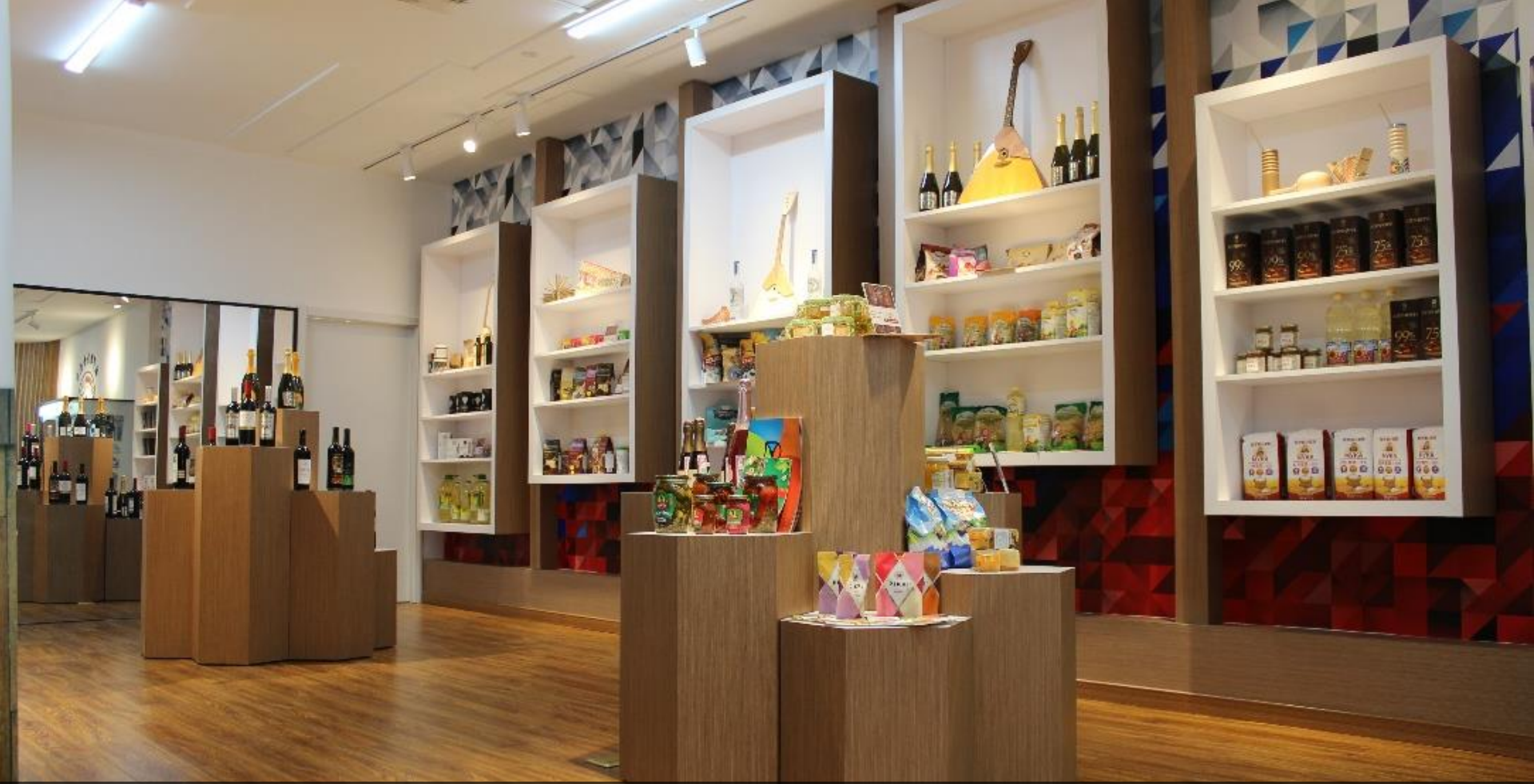
Дегустационные павильоны за рубежом